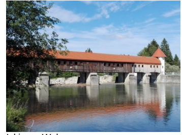
Ickinger Wehr