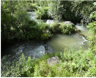
Fischtreppe am Ickinger Wehr